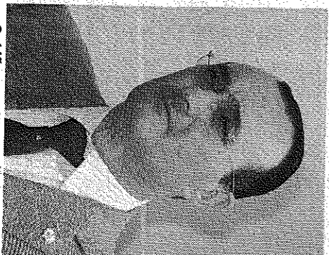
Oubiña, presidente de la Cámara.

Esta junta electoral se encargará de comprobar el cumplimiento de los requisitos exigidos para la presentación de candidaturas y también resolverá las alegaciones y reclamaciones que se presenten. Además, los componentes de este organismo tendrán que custodiar los votos que se reciban por co-