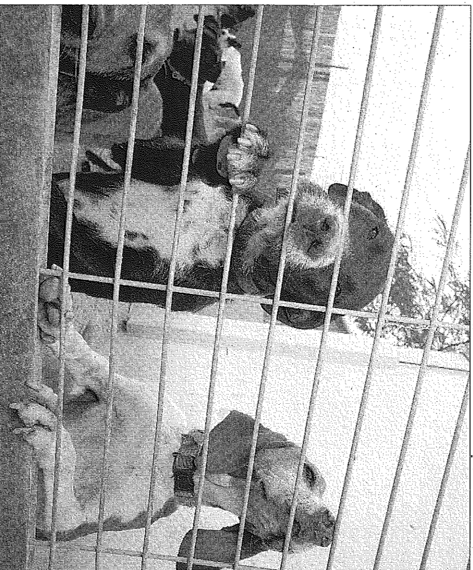
Perros alojados en el refugio de Pinar do Rei.

La Fundación Affinity selecciona el refugio vilagarciano, al que concede una ayuda de 2.500 euros ► Evita desplazar animales