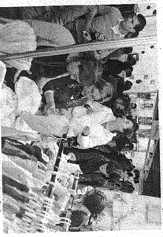
Miles de persoas pasaron por cada una de las ediciones de Expoferta.

Entonces fueron 83 los comerciantes que se dieron cita en Expoferta, contando con la novedad de que por primera vez se permitió la asistencia de no asociados al Zona Aberta.